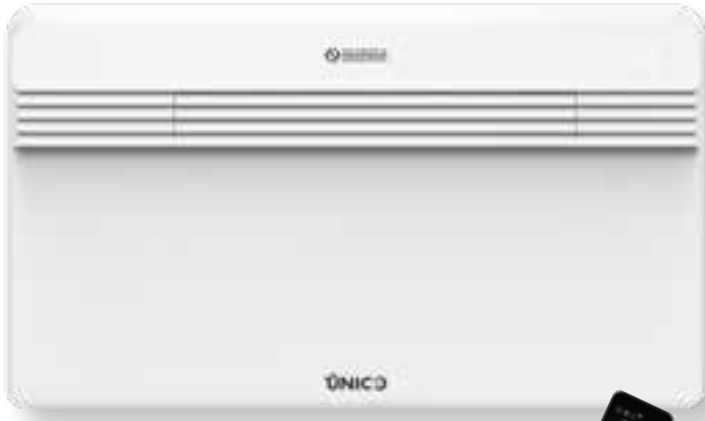
Design by Matteo Thun & Antonio Rodriguez