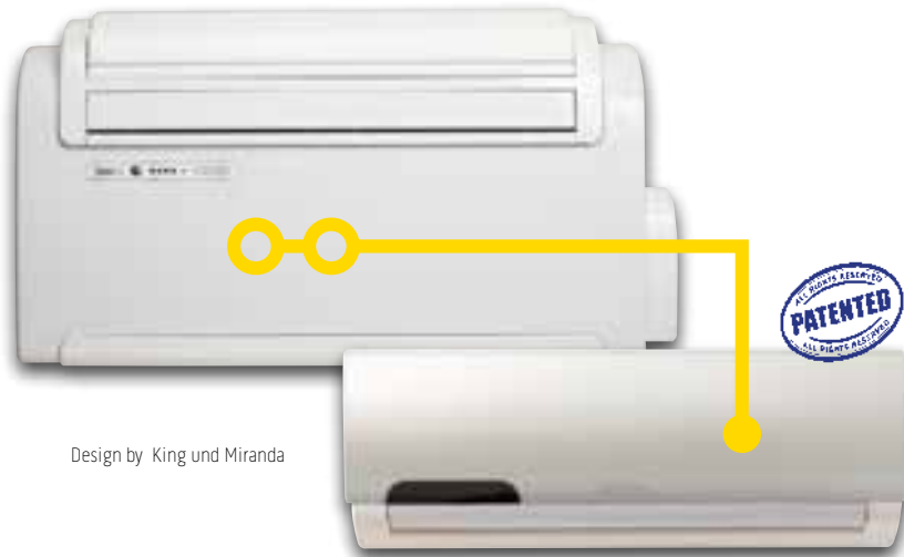
Design by King und Miranda

Das System ohne Außeneinheit für die gleichzeitige Klimatisierung von zwei Räumen. Zwei Inneneinheiten, die traditionelle Einheit UNICO und die Einheit UNICO WALL sind durch einen Kühlkreislauf miteinander verbunden.